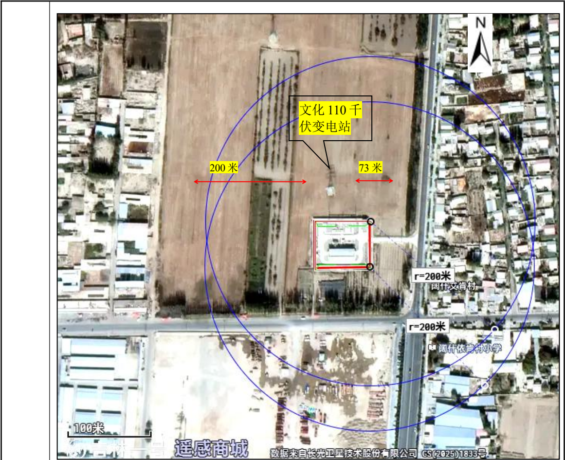
图 3-2 声环境保护目标分布图